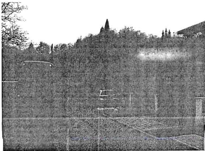
Parkujúci autobus Pod Kalváriou v Prešove dňa 7.11.2013